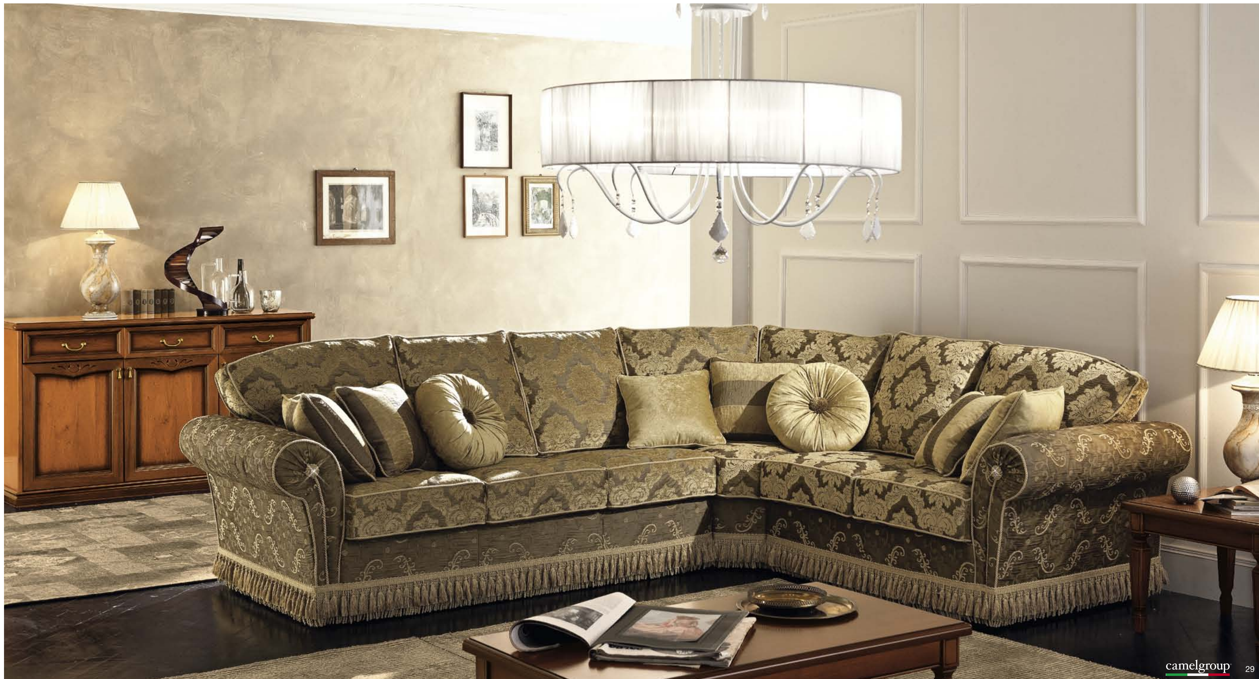
Divano Nostalgia Rivestimento: Decò Categoria: Lux