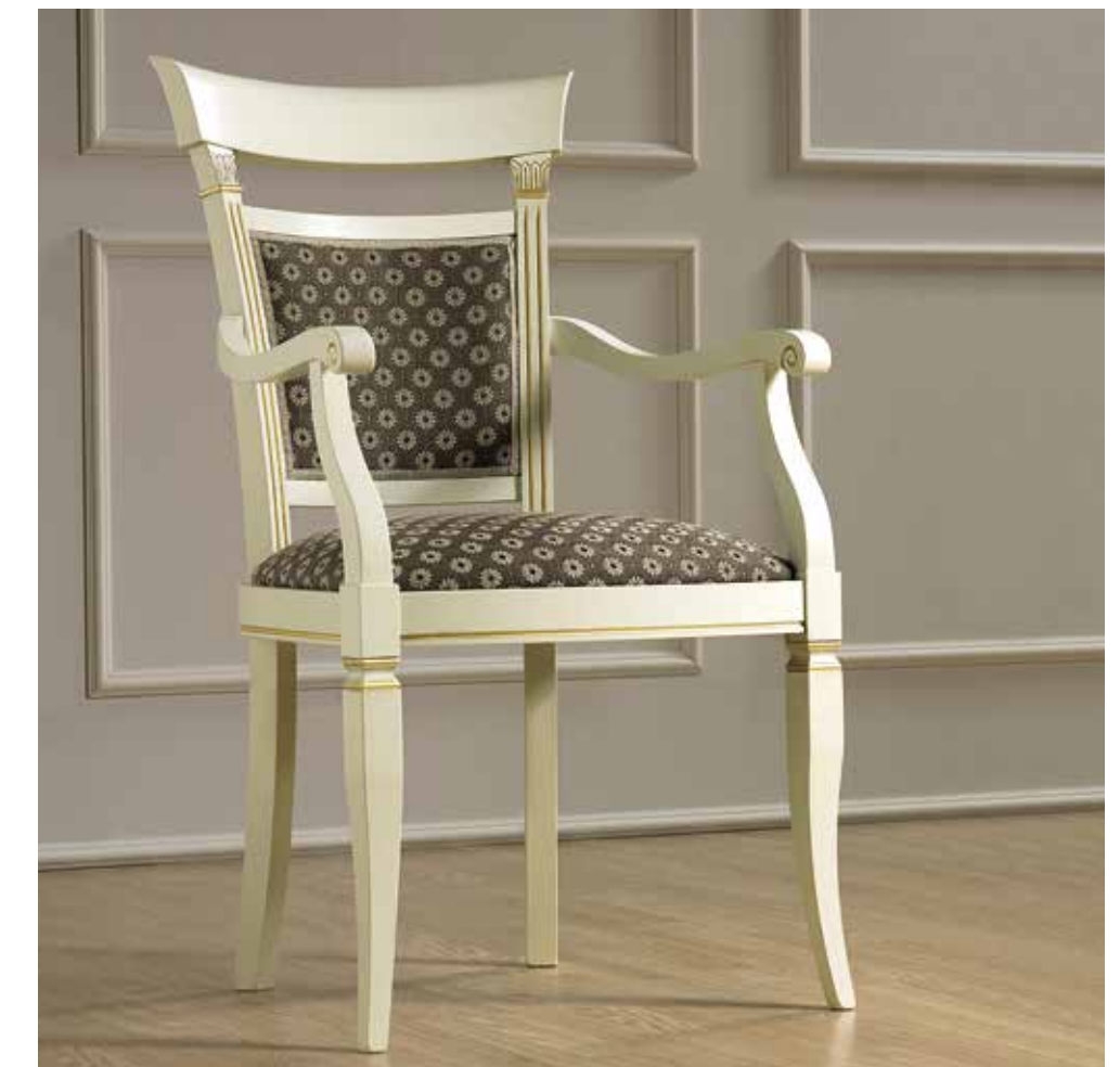
COD. 134CAP.01FRMS75 - SATURN 9