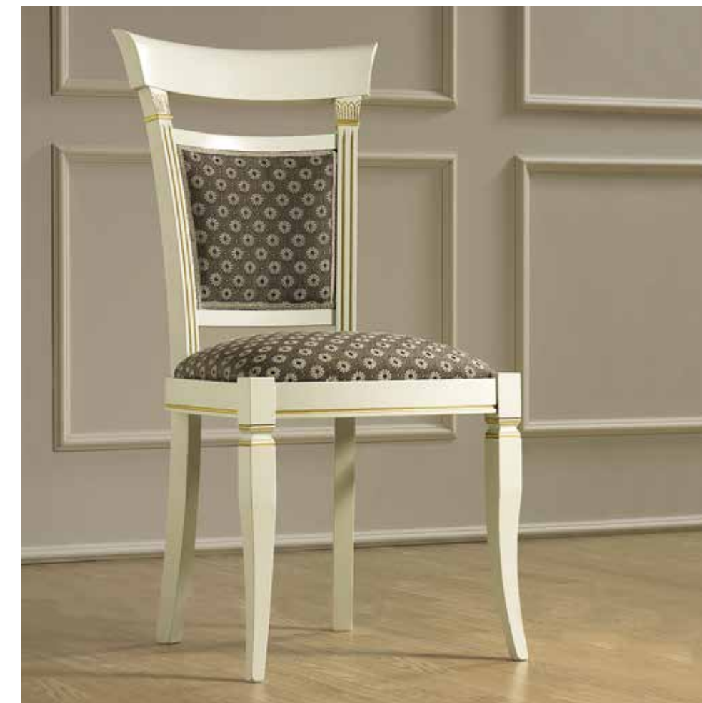
COD. 134SED.01FRMS75 - SATURN 9